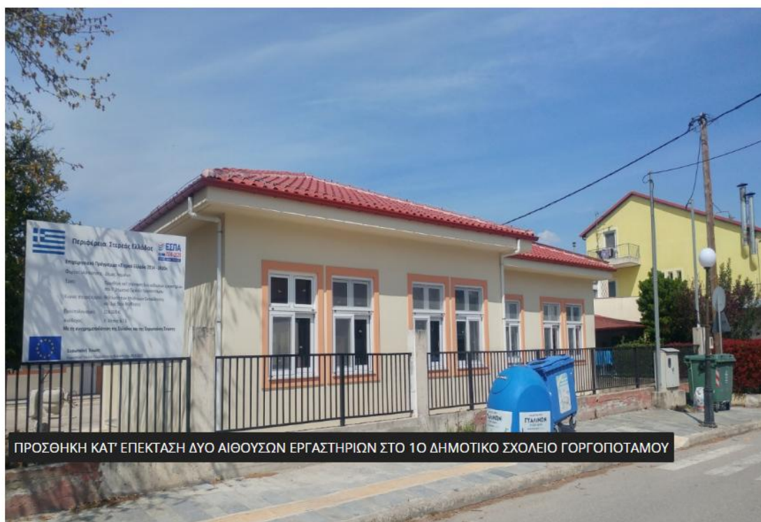
ΠΡΟΣΘΗΚΗ ΚΑΤ' ΕΠΕΚΤΑΣΗ ΔΥΟ ΑΙΘΟΥΣΩΝ ΕΡΓΑΣΤΗΡΙΩΝ ΣΤΟ 1Ο ΔΗΜΟΤΙΚΟ ΣΧΟΛΕΙΟ ΓΟΡΓΟΠΟΤΑΜΟΥ