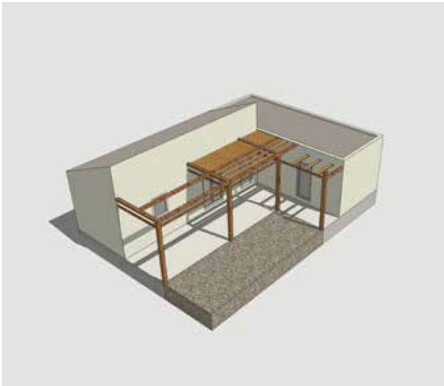
Εικόνα 3: Παράδειγμα Τύπου Κατοικίας για 3-5 ατόμων

Σε περιοχές όπου έχουν ολοκληρωθεί οι υποδομές ή βρίσκονται σε διαδικασία ολοκλήρωσης, αλλά οι συνθήκες στέγασης για ένα μέρος του πληθυσμού ή στο σύνολο του είναι ακατάλληλες υπάρχει η δυνατότητα αντικατάστασης παραπηγμάτων με οικισμούς. Τα οικόπεδα όπου θα εγκατασταθούν οι οικίσκοι δύναται να είναι ιδιόκτητα (με τίτλους κυριότητας) ή / και παραχωρημένες δημοτικές / δημόσιες εκτάσεις.