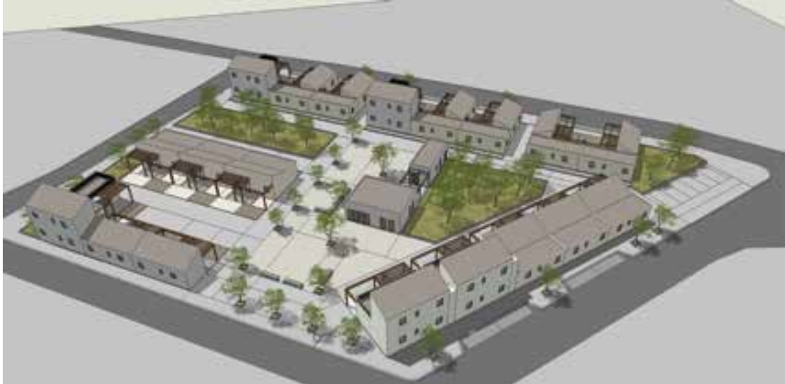
Εικόνα 1: Γενική άποψη οικισμού μετεγκατάστασης Δήμος Φαρσάλων

Σε θύλακες και καταυλισμούς όπου οι συνθήκες διαβίωσης είναι μη αποδεκτές και ο πληθυσμός διαβιεί σε παραπήγματα και χωρίς πρόσβαση σε βασικά αγαθά (ηλεκτροδότηση, νερό, αποχετευτικό σύστημα, κ.λπ.), ο δήμος δύναται μέσω του νομοθετικού πλαισίου, όπως αυτό αναφέρεται στο νόμο 4483/2017, άρθρο 159, να αναπτύξει οργανωμένο χώρο μετεγκατάστασης είτε σε νέα προτεινόμενη κατάλληλη έκταση ή εντός του υφιστάμενου καταυλισμού εφόσον τηρούνται οι απαιτούμενες προδιαγραφές.